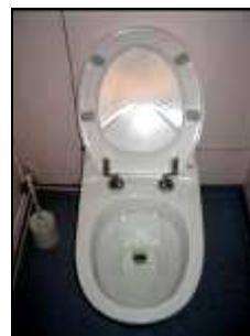
Toilette à chasse sous vide