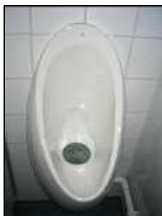
Urinoir sans eau

Cette exposition comprend plusieurs toilettes écologiques en fonctionnement (urinoirs sans eaux et toilettes à séparation des urines avec ou sans chasse d'eau) ainsi qu'une exposition sur le circuit domestique de l'eau, les enjeux de l'assainissement et les principes de l'assainissement écologique. Les urines venant des systèmes séparatifs de l'exposition sont collectées dans 2 tanks de 1 m 3 .