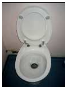
Toilette à micro-chasse