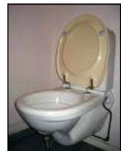
Toilette à séparation à double chasse